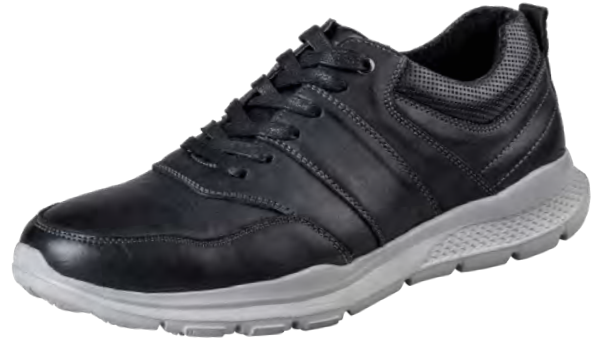
G12-12226- 260 +KAMEA / CAMEL